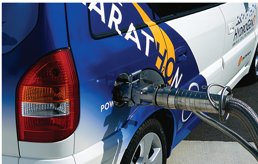
Una operazione che in un futuro (prossimo) diverrà quotidiana: nella foto l'HydroGen3 della GM si rifornisce di idrogeno.

Non c'è dubbio: la realizzazione di cicli eco-energetici chiusi è la vera sfida per l'energia di domani. Riuscire ad avere energia senza «consumare» risorse e senza «produrre» rifiuti, ma utilizzando il ciclo naturale di elementi rigenerabili è la prospettiva che evidenzia con forza straordinaria tutto l'interesse dell'opportunità di adozione diffusa dell'idrogeno come nuovo vettore energetico.