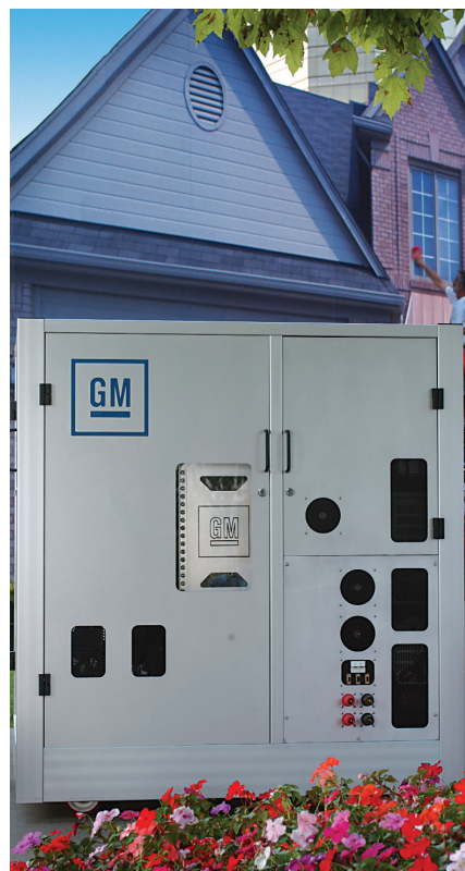
Esempio di cella a combustibile fissa ad uso residenziale.

Il contributo di energia elettrica prodotta da fonti aleatorie o discontinue (vento, sole, ecc.) è stimato pari a circa il 10%, in accordo con le stime che indicano come un contributo superiore al 30% in termini di potenza installata non possa essere accettato.