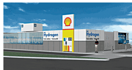
Vista virtuale della Multi Fuel Station della Shell realizzata in Islanda

l'idrogeno è intorno ai 120 MJ/kg mentre quello del petrolio è circa 42 MJ/kg) ed il più «pulito» (il calore sviluppato