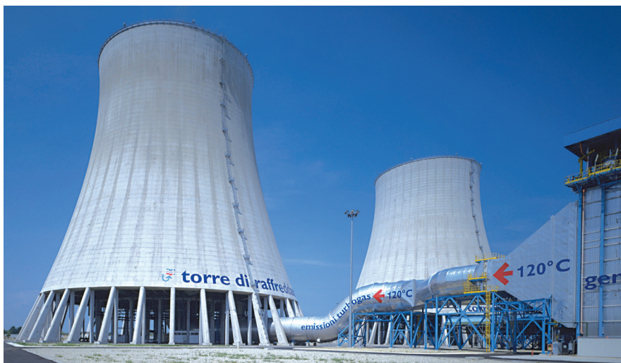
Centrale termoelettrica di Trino: in evidenza le monumentali grandi torri di raffreddamento e la condotta di adduzione del turbogas.

Ai sensi della legge 9 aprile 2002, n. 55, di conversione in legge, con modificazioni, del decreto-legge 7 febbraio 2002, n. 7 recante misure urgenti per garantire la sicurezza del sistema elettrico nazionale, sono stati avviati 74 procedimenti, finalizzati all'autorizzazione alla costruzione di nuovi impianti di generazione di energia elettrica o al ripotenziamento di impianti esistenti superiore a 300 MW termici. Con l'applicazione delle nuove norme in materia di autorizzazioni il periodo procedimentale risulta di poco superiore all'anno. Le difficoltà incontrate nel corso delle procedure condotte ai sensi della citata legge n. 55/02 sono riconducibili ai tempi per il completamento della Valutazione di Impatto Ambientale, e per l'ottenimento del