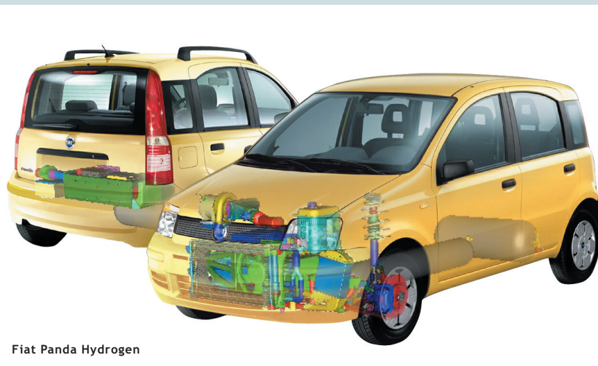
Fiat Panda Hydrogen

Sempre nel 2003 è stato presentato un nuovo progetto che testimonia l'impegno di Fiat Auto nel campo delle trazioni alternative: la Panda «Hydrogen». Anche in questo caso, la fuel cell , collegata direttamente al motore elettrico di trazione, fornisce al veicolo