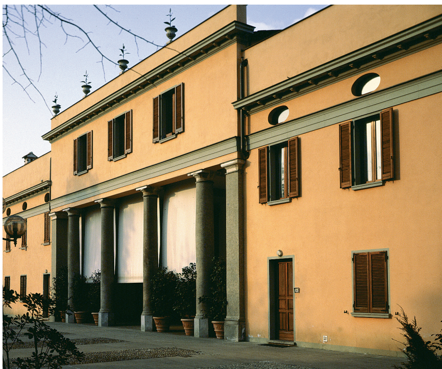
Finestre Giotto con persiane a stecca aperta e portoncino Spuga

Una tra le risposte più importanti a questi problemi è stato l'utilizzo, per gran parte della produzione Piceni, dell'Hemlock, ossia di un legno a crescita veloce, con facile coltivazione su vasta