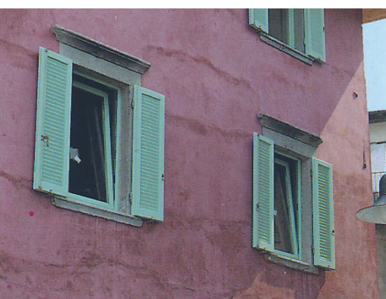
Esempi dell'ampia gamma Piceni

scala che ha caratteristiche di compattezza propria di specie a crescita lenta. L'Hemlock è prodotto in boschi coltivati, con un'attenta pianificazione dei rimboschimenti che sono a garanzia, da una parte, dell'immediata e continua reperibilità della materia, dall'altra del non impoverimento del patrimonio forestale, nella piena consapevolezza che la richiesta sempre più massiccia di es-