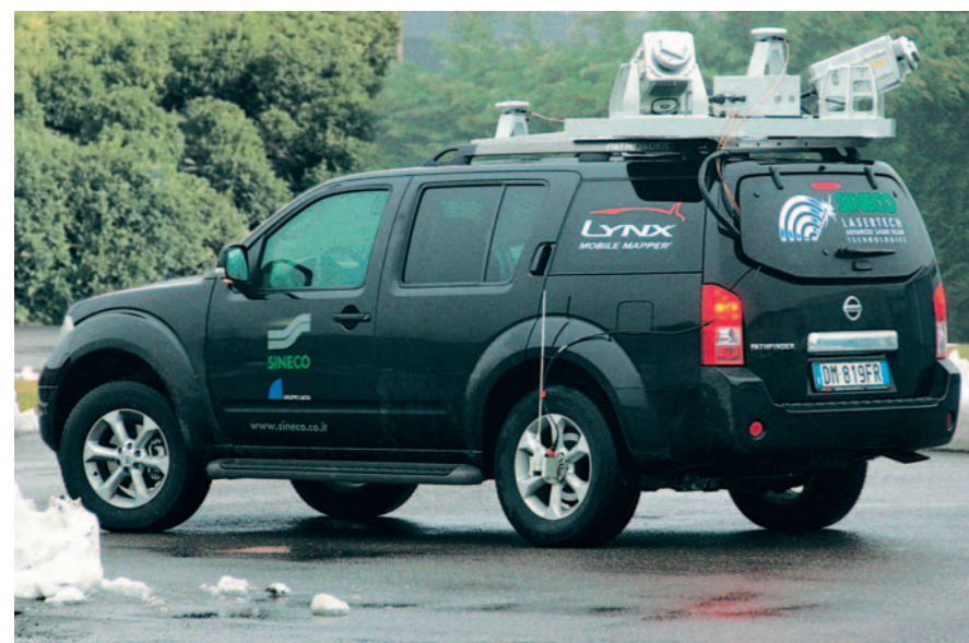
Il veicolo integrato Lynx Mobile Mapper

**Dipartimento di Ingegneria Idraulica Ambientale, Rilevamento e Infrastrutture Viarie, D.I.I.A.R., Politecnico di Milano