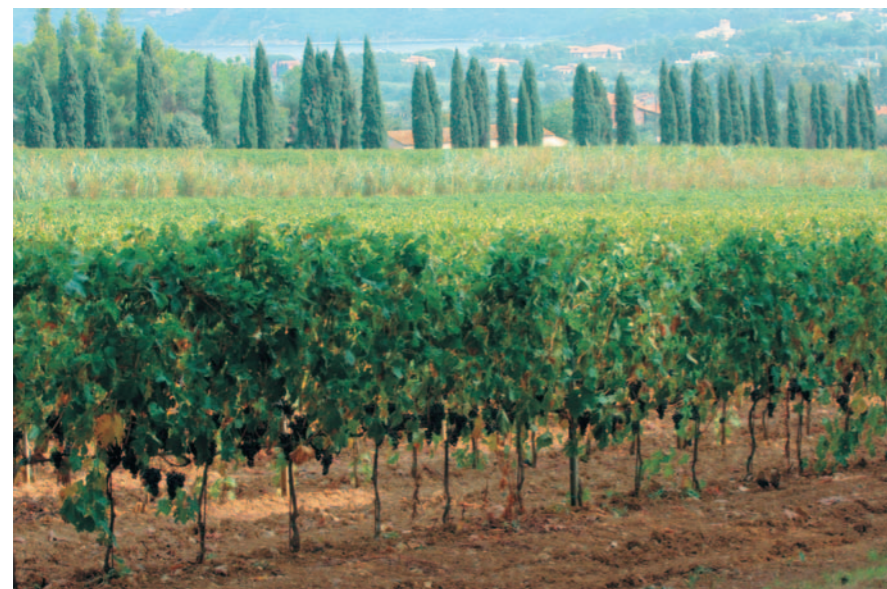
Toscana: vigneto allevato a spalliera