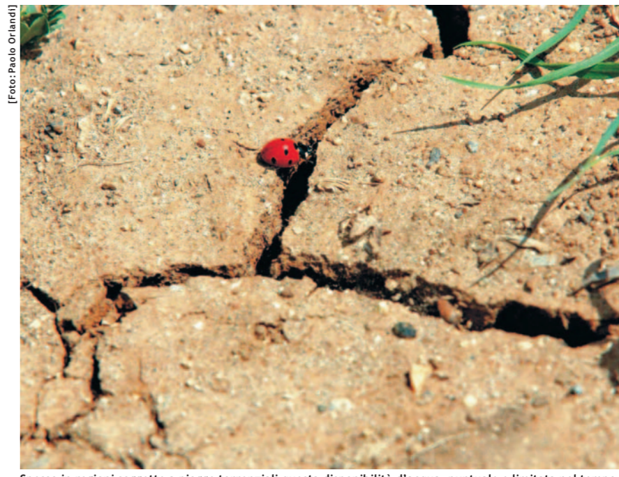
Spesso in regioni soggette a piogge torrenziali questa disponibilità d'acqua, puntuale e limitata nel tempo, fa contrasto con lunghi periodi di persistente siccità, rendendo più difficile il completamento dei cicli culturali