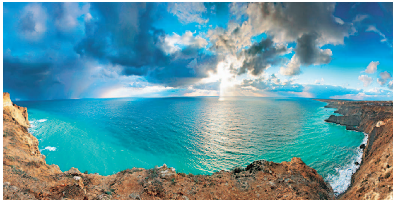
Alla spesso scarsa disponibilità di acqua per la vita dell'uomo e per gli ecosistemi, fanno riscontro immense risorse idriche potenziali

Fra quelle cosiddette strutturali possono annoverarsi tutte le opere che concorrono ad effettuare le necessarie trasformazioni nello spazio (opere di captazione, di adduzione, di distribuzione idrica, di drenaggio urbano, di modificazione degli alvei fluviali), nel tempo (opere di invaso, laminazione delle piene, ecc.) e nella qualità (impianti di potabilizzazione e di trattamento, operazioni di abbattimento dell'inquinamento nei corpi